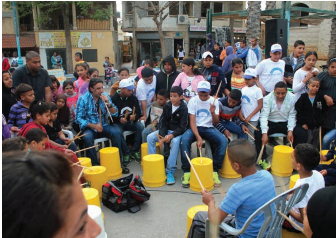
אירוע השקת השביל - חגיגה של כל היישוב

קראו בקישור על פרויקט שביל ג'סר א-זרקא ועל התהליך הפדגוגי שהתרחש במסגרתו