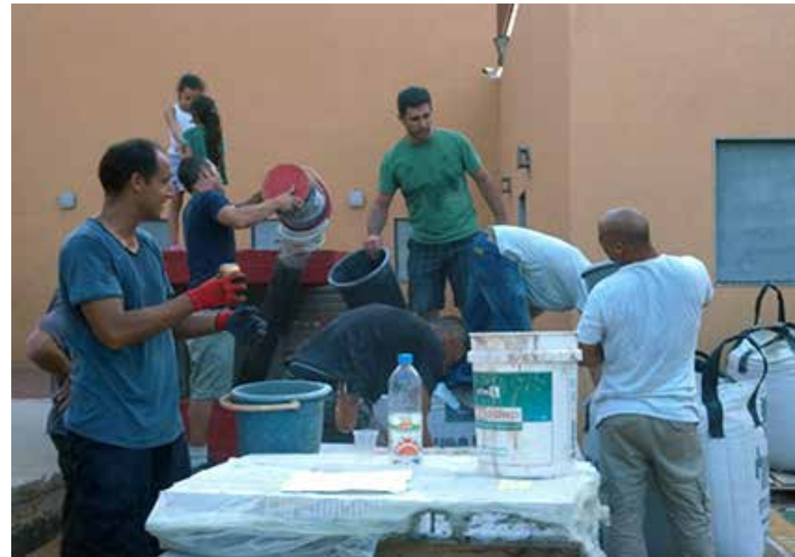
אתם מוזמנים להיכנס לאתר המוזיאון לביקור במוזיאון ולהכרת התהליך הפדגוגי-קהילתי של הקמתו:

היישוב ג'סר א-זרקא ידע אתגרים קהילתיים-חינוכיים רבים ומורכבים ביותר. כחלק מתכנית מקיפה לשיפור תחום החינוך ביישוב (שהשפעתה הייתה בסופו של דבר רחבה יותר מהשפעה על מערכת החינוך בלבד) הנחה המכון לחינוך דמוקרטי כמה פרויקטים של למידה מבוססת מקום וקהילה. אחד המרתקים שבהם היה "שביל ג'סר". המטרה של פרויקט זה, שבוצע בשיתוף חטיבת הביניים, המועצה המקומית וחברי קהילה רבים, הייתה למקם את היישוב על המפה הישראלית ולחברו לשביל חוצה ישראל, שעד כה עבר סמוך ליישוב אך לא בתוכו. במסגרת תהליך פדגוגי-לימודי-קהילתי נוצר מסלול טיול בתוך היישוב שמתחבר לשביל ישראל. השביל כולל 14 תחנות עניין וידע - חלקן היסטוריות וחלקן קשורות לטבע הייחודי של האזור.