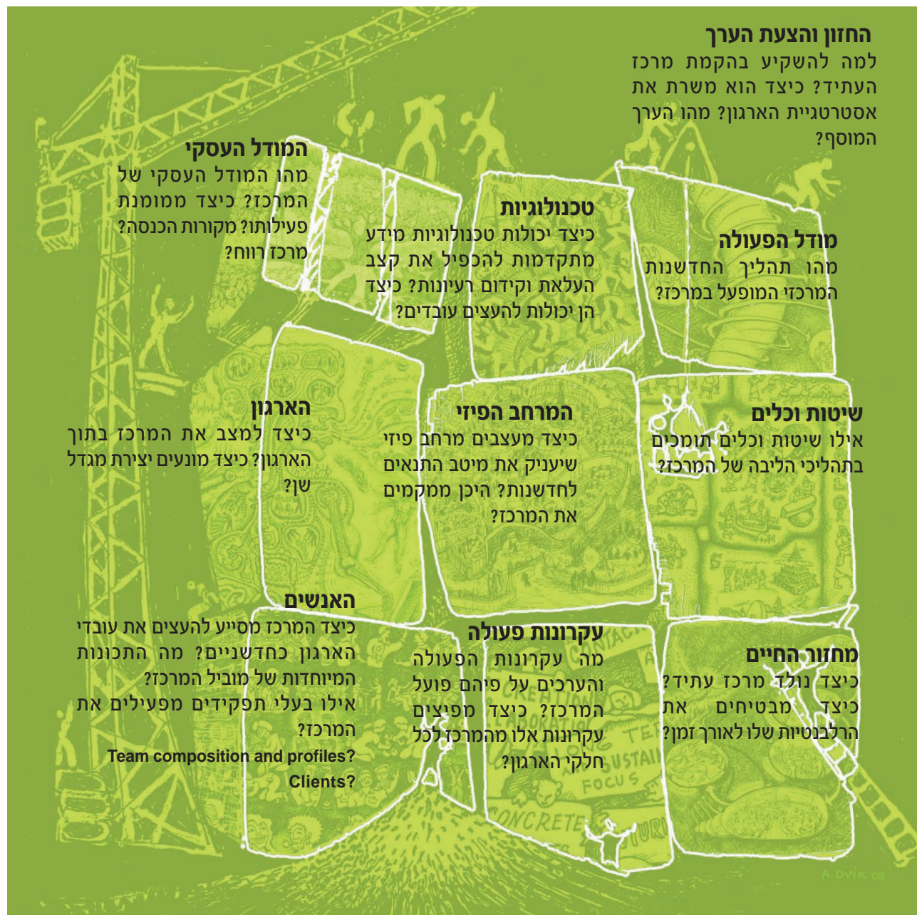
אבני הבניין של מרכזי עתיד. (איור: רון ואריה דביר)

לאחר מספר מסעות משותפים, החליטה קהילת מרכזי העתיד לצאת למחקר משותף שיבנה תורה מקצועית (אנו קראנו לזה "מערכת הפעלה") להקמת והפעלת מרכזי עתיד. במימון הקהילה האירופית יצא לדרך פרוייקט מחקר ופיתוח בינלאומי, OpenFutures, שחקר וביקר בעשרות מרכזי עתיד, זיהה מודלים, שיטות, כלים וגורמי הצלחה וכשלו. ריכזנו אותם במודל שנקרא "אבני הבניין של מרכזי חדשנות" (Dvir, 2008), ועל פיו כשמתכננים מרכז יש לתכנן כעשרה מרכיבים שונים, וכמובן לחבר אותם בדרך חכמה. יותר מכך, חשבנו שלא תמיד צריך להקים מרכז עתיד (דביר, 2008). אפשר בהחלט לישים הרבה מעקרונותיו בכל סביבת עבודה. באיור כמה מהשאלות המטופלות בכל אחד מאבני הבניין.