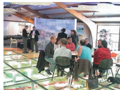
מסע אל 5 מרכזי עתיד בהולנד (קבוצה בינלאומית בונה קונספט למיזם מו"פ. צולם במרכז העתיד למים ותחבורה), 2005

6. לאחר בחינת התוצאות ושיפור המוצר שפותח, הוא מיושם בהיקף רחב במערכת כולה.