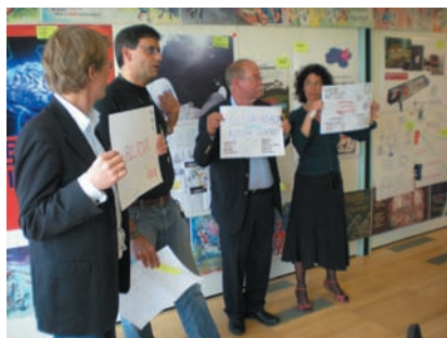
פסגת מרכזי עתיד בשבדיה (החלפת best practices), 2008