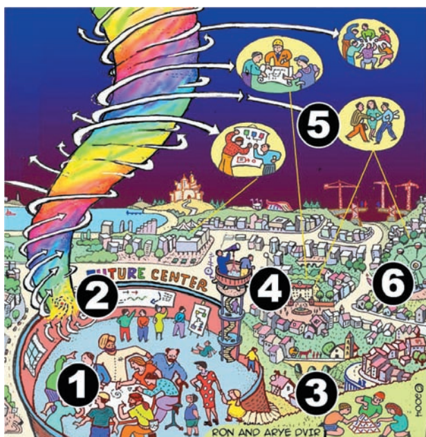
מדיאלוג לתמונות עתיד, ומשם לפתרונות. איור: רון ואריה דביר, 2004

כל מרכז פיתח תהליך ליבה ייחודי - דרך מובנה לנוע מאתגרים מורכבים לפתרונות חדשים וגישות פורצות דרך. אחד התהליכים מתואר בתרשים הבא: